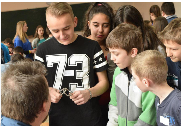
A MatNap alkalmából mindannyian ellátogattunk a számok birodalmába, ahol az ördöglakatoktól kezdve a társasjátékokig mindent kipróbáltunk, illetve sok-sok számtanfeladványt is oldottunk.