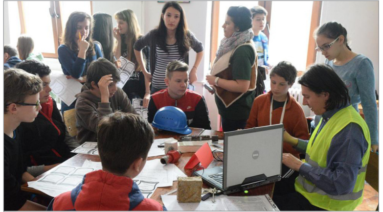
A „Mesterségem Címere” program keretén belül nagyon sok szakmával ismerkedhettünk meg.

A két VI. osztály úszással zárta az érdekes programokkal teli hetet.