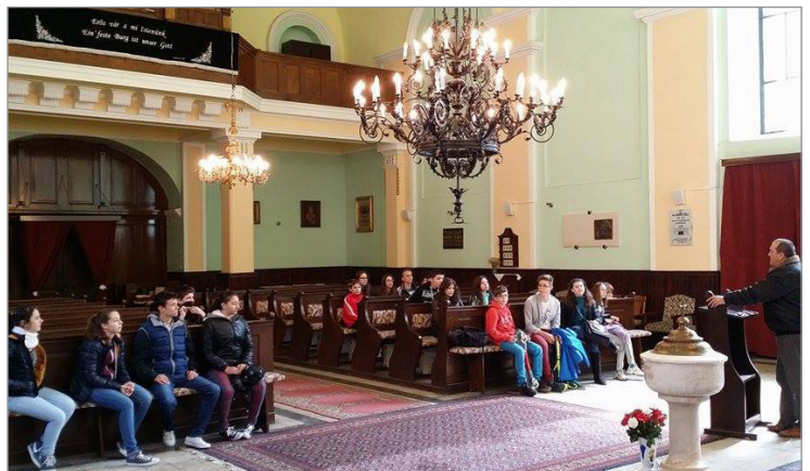
A VII. A osztály meglátogatta a temesvári evangélikus templomot, ahol érdekes dolgokat tanulhatott, mint például mi az a chronogramma, illetve nagyon sok információt tudhatott meg a templomról.