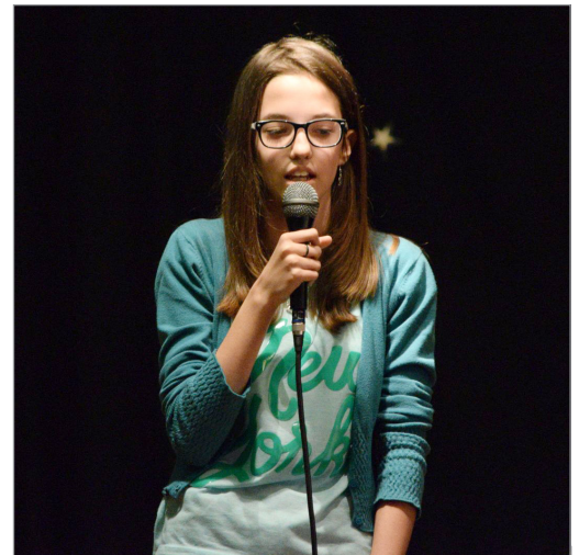
A B-factor keretén belül a diákok bemutatták, hogy ki miben tehetséges. Voltak, akik énekeltek, volt, aki beatboxolt, illetve volt, aki stand up comedy-hez hasonló előadással szórakoztatta a közönséget.