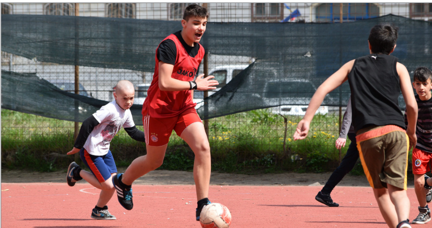
Az V-VIII osztályosok számára szervezett labdarúgó bajnokság győztese a VIII.B osztály lett.

A két VI. osztály úszással zárta az érdekes programokkal teli hetet.