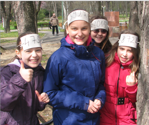
A két V. osztály trambulinozni ment majd közös számháború-játékon vett részt a központi parkban.